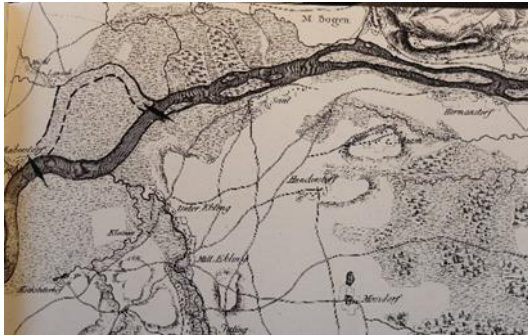
Flusskarte der Donau, 1806 (Neueder 2012)

Die erhobenen Daten und Ergebnisse der Recherchen sowie Feld- und Laborarbeit werden über GIS, statistische Analysen und Grafikprogramme dargestellt, interpretiert und kritisch diskutiert.